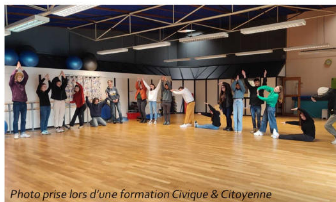
Photo prise lors d'une formation Civique & Citoyenne